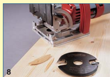
8 Μία φρεζοκαβιλιέρα είναι απαραίτητη σε βαθιές «φωλιές» ρετσινιού. Στα σκαμμένα σημεία τοποθετούνται λαμέλα ή κομμάτια από το ίδιο ξύλο.