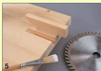
5 Με το δισκοπρίνο και πολλές παράλληλες εγκοπές, αφαιρέστε τα ελαττωματικά σημεία στις ακμές. Κολλήστε στα ανοίγματα τα κατάλληλα πηχάκια.