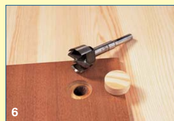
6 Με τρυπάνι τύπου forstner και έναν οδηγό από κοντραπλακέ, ανοίγετε την τρύπα για την αφαίρεση του ρόζου. Κλείνετε με ροδέλα από το ίδιο ξύλο.