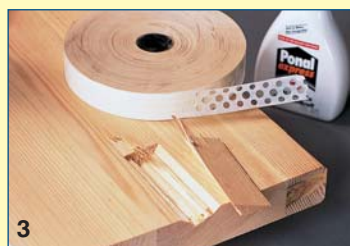
3 Για να κολλήσετε ένα απόφιο σπασμένου κομμάτι, εφαρμόζετε την ίδια μέθοδο. Δοκιμάστε πρώτα την εφαρμογή του στερεώνοντάς το πρόχειρα.