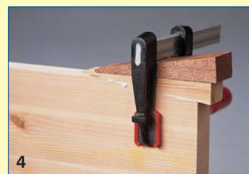
4 Συμπληρώστε μια σπασμένη γωνία σανίδας με μια σφήνα με την ίδια κατεύθυνση ινών. Πιέστε την κάτω από το σφιγκτήρα με μια δεύτερη σφήνα.