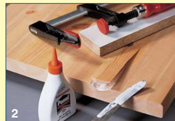
2 Με ένα μαχαίρι ανασηκώνετε τους ετήσιους δακτύλιους. Τους κολλάτε ξανά στη θέση τους, σφιγμένους με σφιγκτήρα και με έναν ξύλινο τάκο.