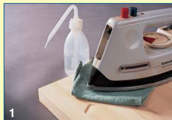
1 Βαθουλώματα από ελαφρά χτυπήματα εξαλείφονται με σιδέρωμα των συμπιεσμένων ινών. Αφού τις βρέξετε, κατόπιν τις σιδερώνετε.

Καθώς πρόκειται για φυσικό υλικό, το ξύλο μπορεί να παρουσιάζει κάποιες φορές ελαττωματικά σημεία. Οι πιο συνηθισμένες περιπτώσεις είναι οι ρόζοι, οι εγκλωβισμένες συγκεντρώσεις ρετσινιού και οι χαλαροί ετήσιοι δακτύλιοι του κορμού. Επίσης, συχνές είναι μικροζημιές και φθορές που ενδέχεται να γίνουν κατά τη διάρκεια της μεταφοράς, του κοψίματος, του πλανίσματος, της λανθασμένης αποθήκευσης, ακόμα και της πιθανής υγρασίας. Όπως και να 'χει πάντως, οι ανωμαλίες που παρουσιάζονται κάθε φορά είναι ιδιαίτερα αντιαισθητικές. Πριν την οποιαδήποτε τελική επεξεργασία του ξύλου λοιπόν, απαραίτητη είναι η αποκατάσταση των ζημιών, χρησιμοποιώντας πάντα τα κατάλληλα υλικά και εργαλεία.