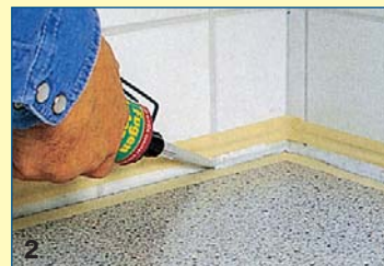
2 Καθαρίζετε καλά τον αρμό και τον σκεπάζετε με το υλικό, πιέζοντας αργά και σταθερά, ώστε να δημιουργηθεί ένα ισόπαχο περίπου κορδόνι.