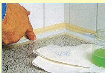
3 Στρώνετε το νωπό υλικό με κάποια μικρή πλαστική σπάτουλα ή και με το δάχτυλό σας, που το έχετε βρέξει με διάλυμα απορρυπαντικού.