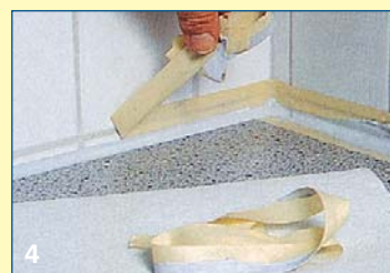
4 Πριν το υλικό στεγνώσει, αφαιρείτε τις χαρτοταινίες με απότομο τράβηγμα και εξομαλύνετε ξανά τον σφραγισμένο αρμό με το δάχτυλό σας.