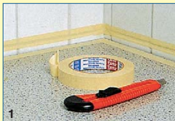
1 Για να έχετε ευθύγραμμη κάλυψη του γωνιακού αρμού, οριοθετείτε τη ζώνη εφαρμογής του σφραγιστικού υλικού με αυτοκόλλητη χαρτοταινία.

Ο πως είναι γνωστό, τα σφραγιστικά υλικά, με βάση το τσιμέντο, ρηγματώνονται εύκολα, οι ασφαλικές επικαλύψεις έχουν άσχημη εμφάνιση και τα διάφορα γωνιακά προφίλ συνήθως δεν στεγανοποιούν ικανοποιητικά. Οι φύσιγγες με τα νέα, σιλικονούχα υλικά ήρθαν να λύσουν τα προβλήματα αυτά, καθώς σκληραίνουν, διατηρώντας καλή πρόσφυση και μόνιμη ελαστικότητα. Για αρμούς σύνδεσης και ρωγμές σε χώρους που καταπονούνται ιδιαίτερα (μπάνια, κουζίνες, παράθυρα), οι σιλικόνες εξασφαλίζουν μεγάλη αντοχή και άριστη στεγανοποίηση. Δεν βάνονται, κυκλοφορούν όμως σε πολλές αποχρώσεις. Ειδικά για χώρους ζεστούς και υγρούς, συνιστώνται οι μυκητοκτόνες, αντιμυκηλικές σιλικόνες. Στις συσκευασίες αναφέρεται και το κατά πόσον το υλικό είναι ανθεκτικό στην υπεριώδη ακτινοβολία και τις δυσμενείς καιρικές συνθήκες, κατάλληλο επομένως για εξωτερικούς χώρους.