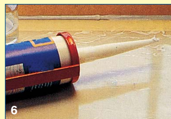
6 Για τις χαραμάδες σε κάσες και περβάζια που απαιτούν σφράγισμα, υπάρχουν σιλικόνες σε πολλές αποχρώσεις ή και διαφανείς.