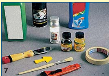
7 Βοηθητικά μέσα: Διαλυτικό ή καθαριστικό σπρέι για την απολίπανση του αρμού, απορρυπαντικό, χαρτοταινία, κοπίδι και μικρές σπάτουλες.