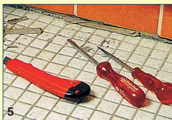
5 Αν ένας γωνιακός αρμός είναι κλεισμένος με στόκο, για να τον βγάλετε, κόβετε κατά μήκος με το κοπίδι και τον σπάζετε σε μικρά κομμάτια.