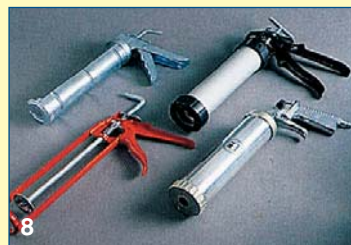
8 Πιστόλια για τις φύσιγγες υπάρχουν σε πολλούς τύπους, μοντέλα για οικιακή ή για επαγγελματική χρήση και συσκευές για πεπιεσμένο αέρα.