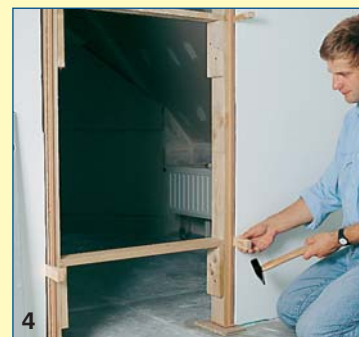
4 Η κάσα στηρίζεται γύρω-γύρω με μέσα στο άνοιγμα του τοίχου και αλφαδιάζεται σωστά, με έναν αέρα 1,5 έως 2 εκ. περιμετρικά. Εσωτερικά αντι-στηρίζεται πάνω και κάτω, αφού καλυφθεί με προστατευτικές σανίδες.