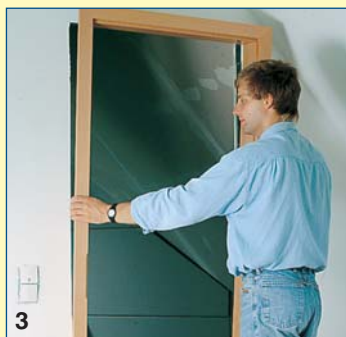
3 Το εσωτερικό κάσωμα τοποθετείται μέσα στο άνοιγμα του τοίχου και αλφαδιάζεται σωστά, με έναν αέρα 1,5 έως 2 εκ. περιμετρικά.