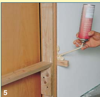
5 Ο αρμός μεταξύ κάσας και τοίχου γεμίζεται με αφρό πολυουρεθάνης, ενός ή δύο συστατικών, και αφαιρείται όσο υλικό περισσεύει.