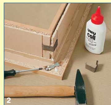
2 Το μοντάρισμα με κόλλα και τους ειδικούς συνδετήρες που περιλαμβάνονται στο σετ είναι σχετικά απλή και εύκολη δουλειά για τον ερασιτέχνη.