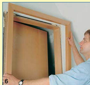
6 Με σταθερή πίεση κολλιέται και το πλαίσιο, ώστε να εφαρμόσει καλά. Το κρέμασμα του θυρόφυλλου διευκολύνει το συνολικό ορθογώνιασμα.